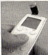
Un simple magnétophone suffit pour réaliser l'expérience.