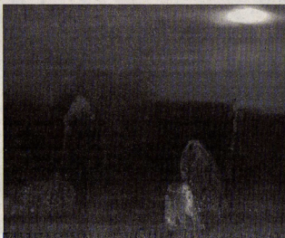
Les phénomènes de hantise seraient nombreux dans la région.